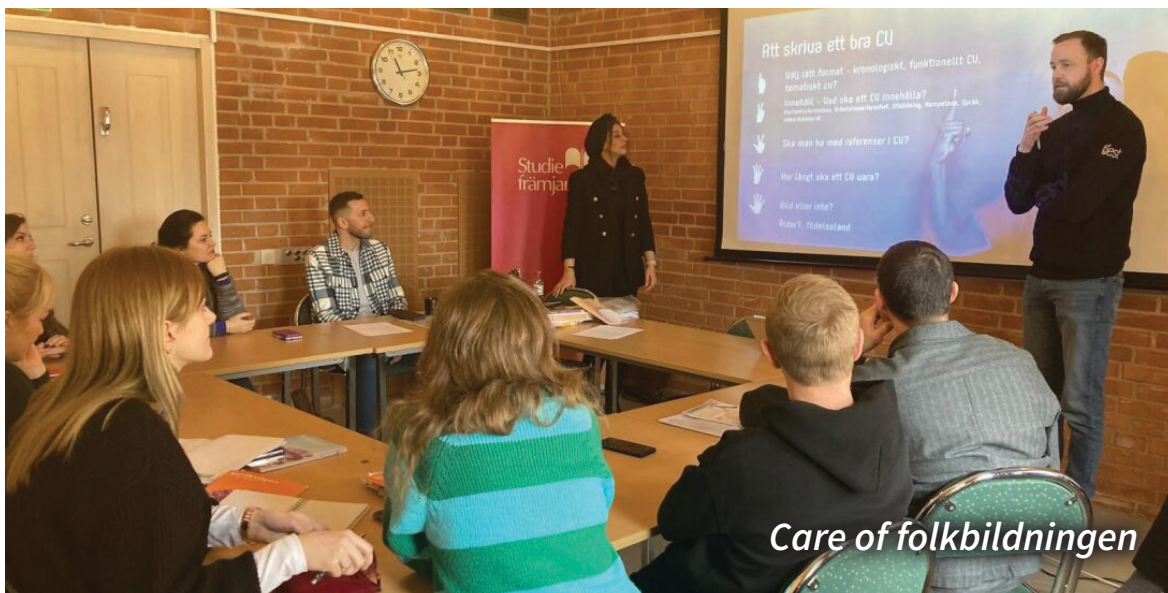
Care of folkbildningen