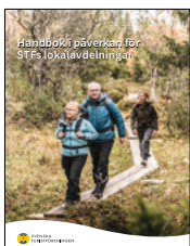
Handbok i lokal påverkan, STF

Det går också att ladda hem Handbok i lokal påverkan på STF:s intranät eller genom att logga in på Friluftsrämjandets medlemsinloggning.