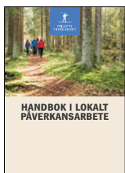
Handbok i lokal påverkan, Friluftsrämjandet

För att genomföra studiecirkeln behöver ni ha tillgång till Handbok i lokal påverkan från Svenska Turistföreningen eller Friluftsrämjandet. Handboken finns tillgänglig både digitalt och i tryckt form och beställs från respektive organisation. Innehållet i de två organisationernas utgåvor är samma, med undantag för det inledande kapitlet som är skrivet specifikt för din organisation.