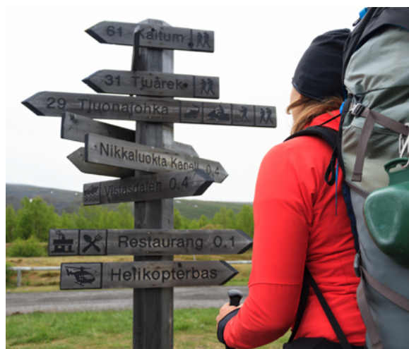
Att skapa debatt är ett sätt att påverka.