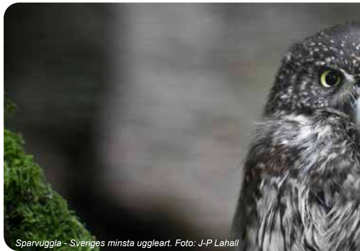
Sparvuggla - Sveriges minsta ugglearart.