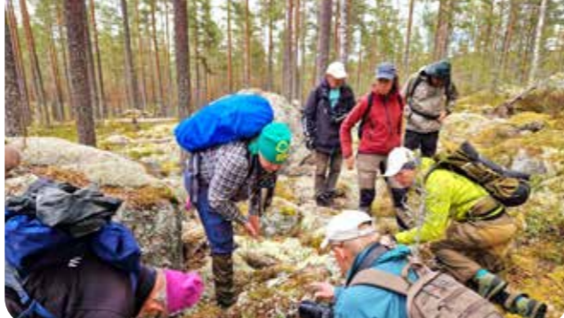
Skogsexkursion i unik tallnaturskog, vid Ore Skogsrike i Dalarna.

I månadens reservat Sundsjömarken, i Hällefors kommun, hittar vi en mosaik av myrar, gammelskogar och skogssjöar, men inga markerade stigar. Därför bjuder vi in till övningar i att navigera i terrängen. Vi provar karta och kompass, mobilens gps-funktioner, samt övar att läsa naturen. Medtag fika och gärna kompass. Samling vid reservatstavlan vid Sundshyttan. Tid: 11-15. Arr: Hopajola, Länsstyrelsen, Studieförbundet m fl.