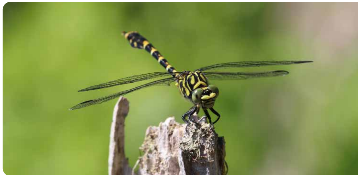
Stenflodtrollslända.