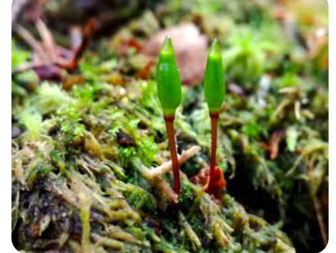
Grön sköldmossa kan man se sticka upp från fallna döda träd likt små gröna lavalampor. Arten är inte hotad i sig, men signalerar att naturen runt växtplatsen har fina naturvärden, eftersom många rödlistade arter trivs i samma typ av miljö. Därför kallas den signalart.