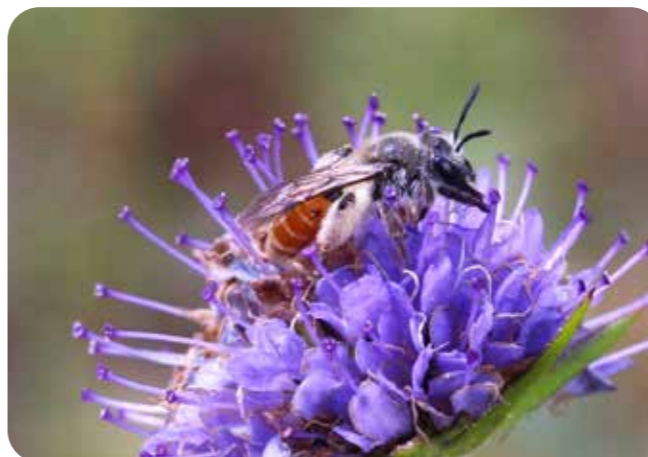
Guldsandbi är en nära hotad art som drabbats hårt av övergödning och ogräsbekämpning på betes- och odlingsmark.

Vi besöker månadens reservat Stora Kortorp, en gård i Hallsbergs kommun med lång odlingshistoria. Markerna betas fortfarande, vilket gynnar ett stort antal växter. Tid: kl 9.30-12.30. Efter lunch kan man följa med på spaning efter guldsandbi och silvergökbi söder om Tisaren, där ett projekt pågår för att gynna vilda pollinatörer. Samling vid gården Stora Kortorp, ca 14 km sydöst om Hallsberg. Arr: Hopajola, Länsstyrelsen, Närkes Insektsförening m fl.