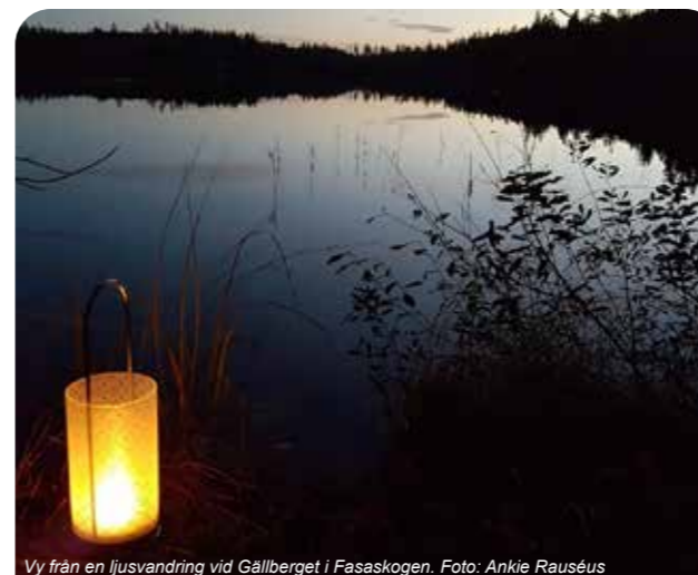
Vy från en ljusvandring vid Gällberget i Fasaskogen.

Följ med på trolsk vandring runt mytomspunna sjön Fagertärn. Genom sagans värld upptäcker vi naturen i det tilltagande mörkret. Ta med fick/pannlampa, ordentliga skor, kläder efter väder, samt fika som ej kräver eld - då eldstad saknas i reservatet. Tid: 14-17. Arr: Hopajola, Länsstyrelsen, Studieförbundet m fl.