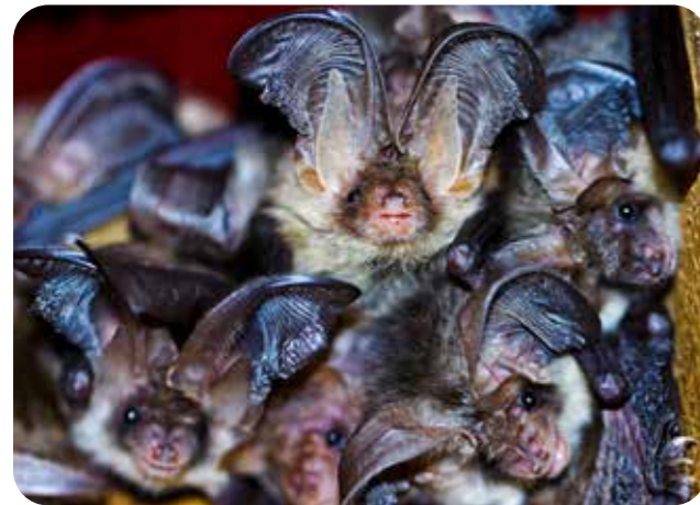
Fladdermöss, upptäckta i en fågelholk.