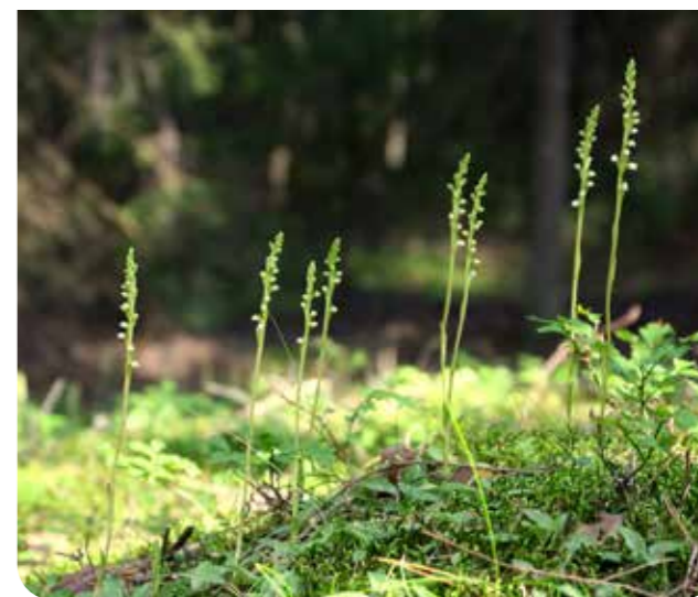
Knärot är en skogsorkidé som idag räknas som "särbar" då arten minskat kraftigt. Den växer främst i äldre barrskog, från fuktig och mossig granskog till torr tallskog.